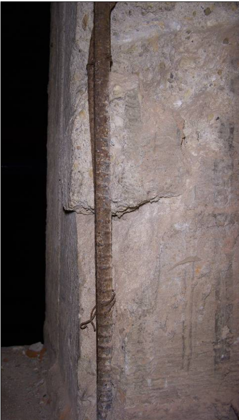
Figura 5 - Dettaglio di armatura ad aderenza migliorata