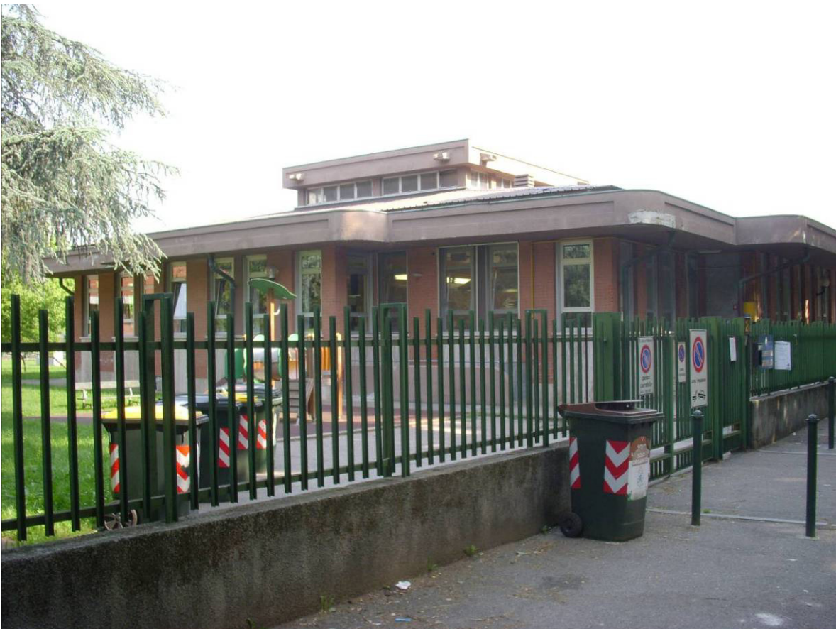
Figura 2 - Vista edificio da c.so Sicilia (lato sud)