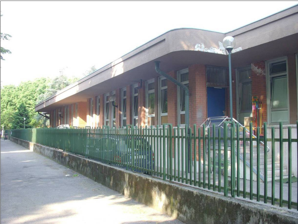
Figura 1 - Vista edificio da c.so Sicilia