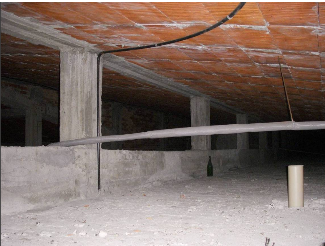
Figura 6 - Vista di parte del sottotetto