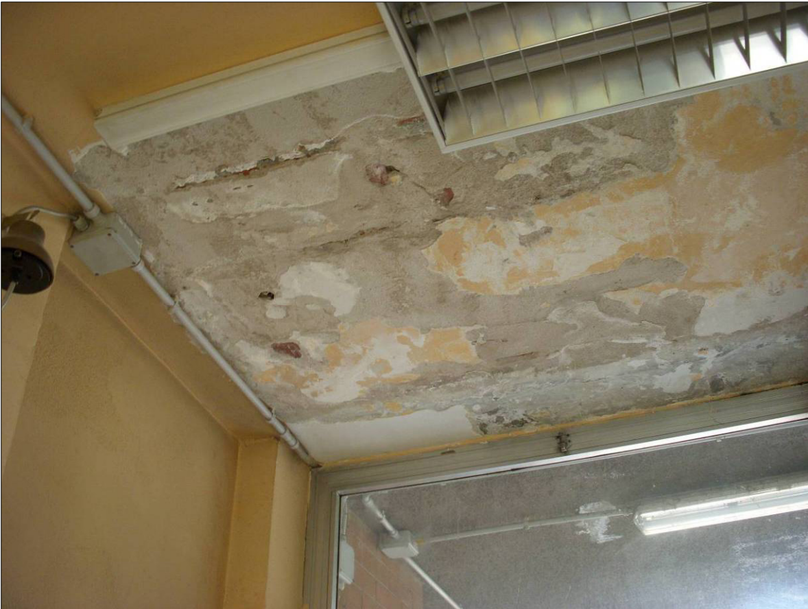
Figura 9 - Parte di solaio ammalorato con tracce d'infiltrazione d'acqua