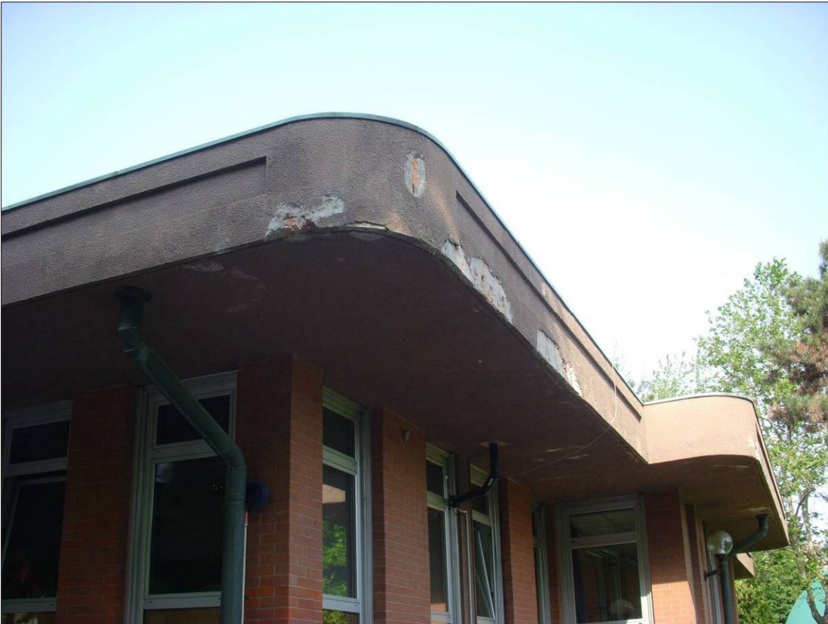
Figura 7 - Calcestruzzo espulso dal cornicione