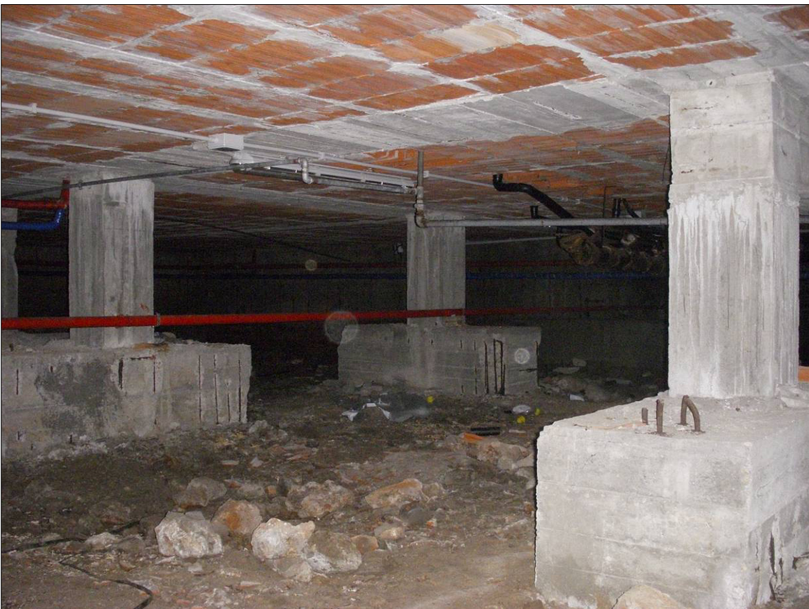
Figura 4 - Strutture di fondazione