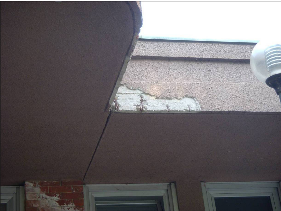
Figura 8 - Vista di dettaglio dell'espulsione del copriferro