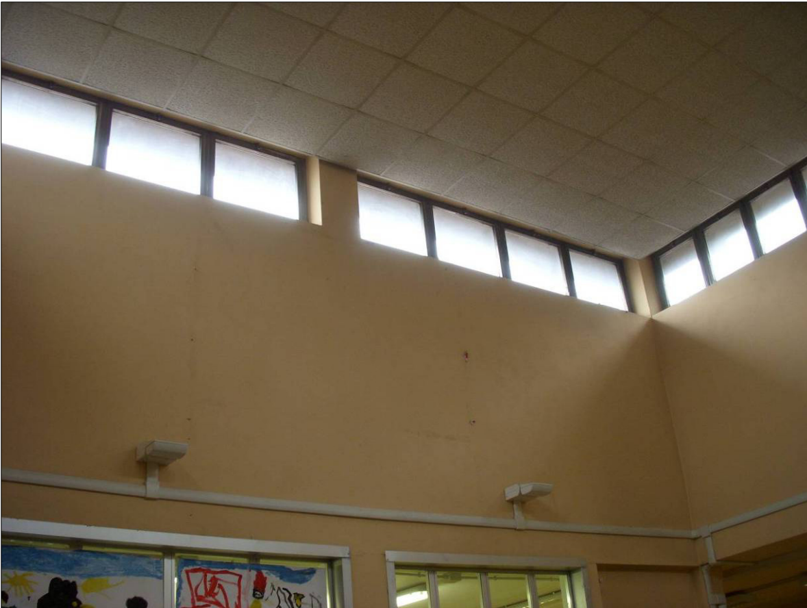
Figura 3 - Stralcio dell'atrio centrale