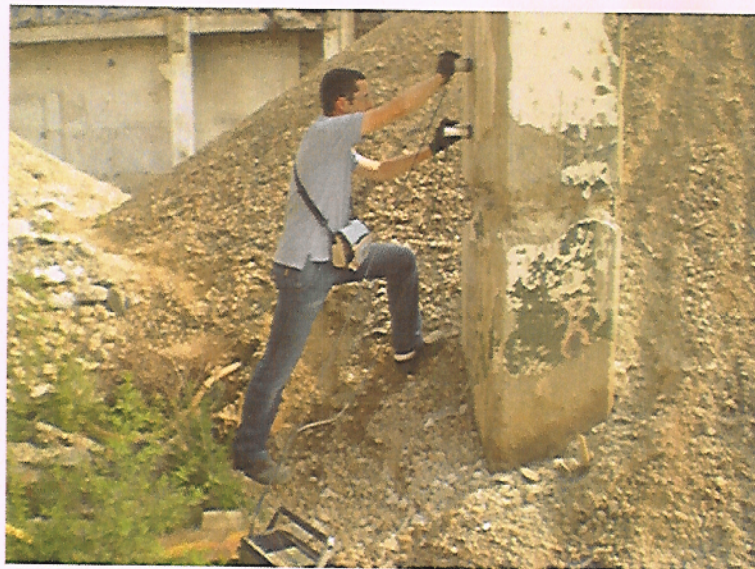
PROVA CON ULTRASUONI