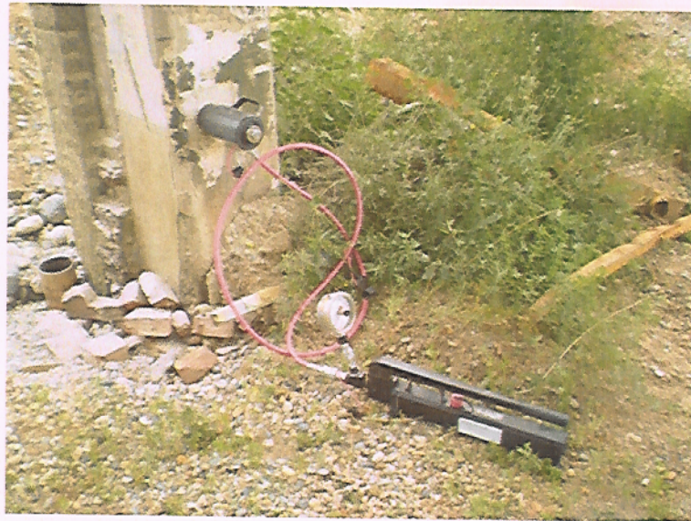
PROVA CON PULL-OUT