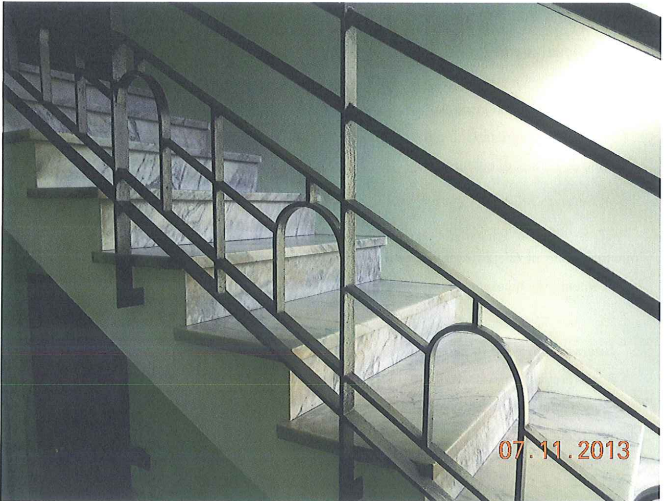
Vano scala Via Nicola Fabrizi – Ringhiera di protezione