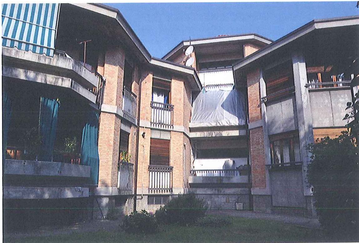
Fronte Est della palazzina principale