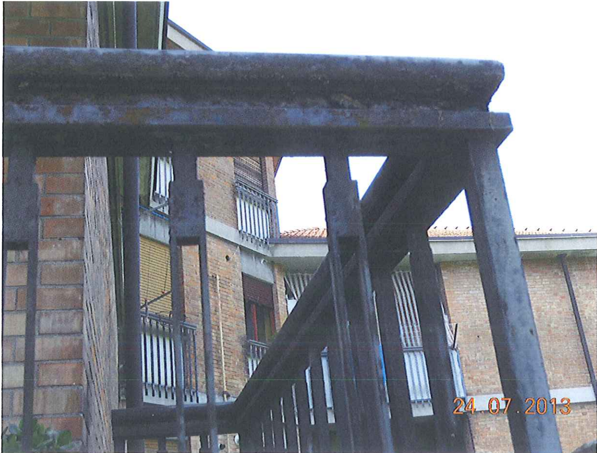
Altri dettagli delle ringhiere deteriorate