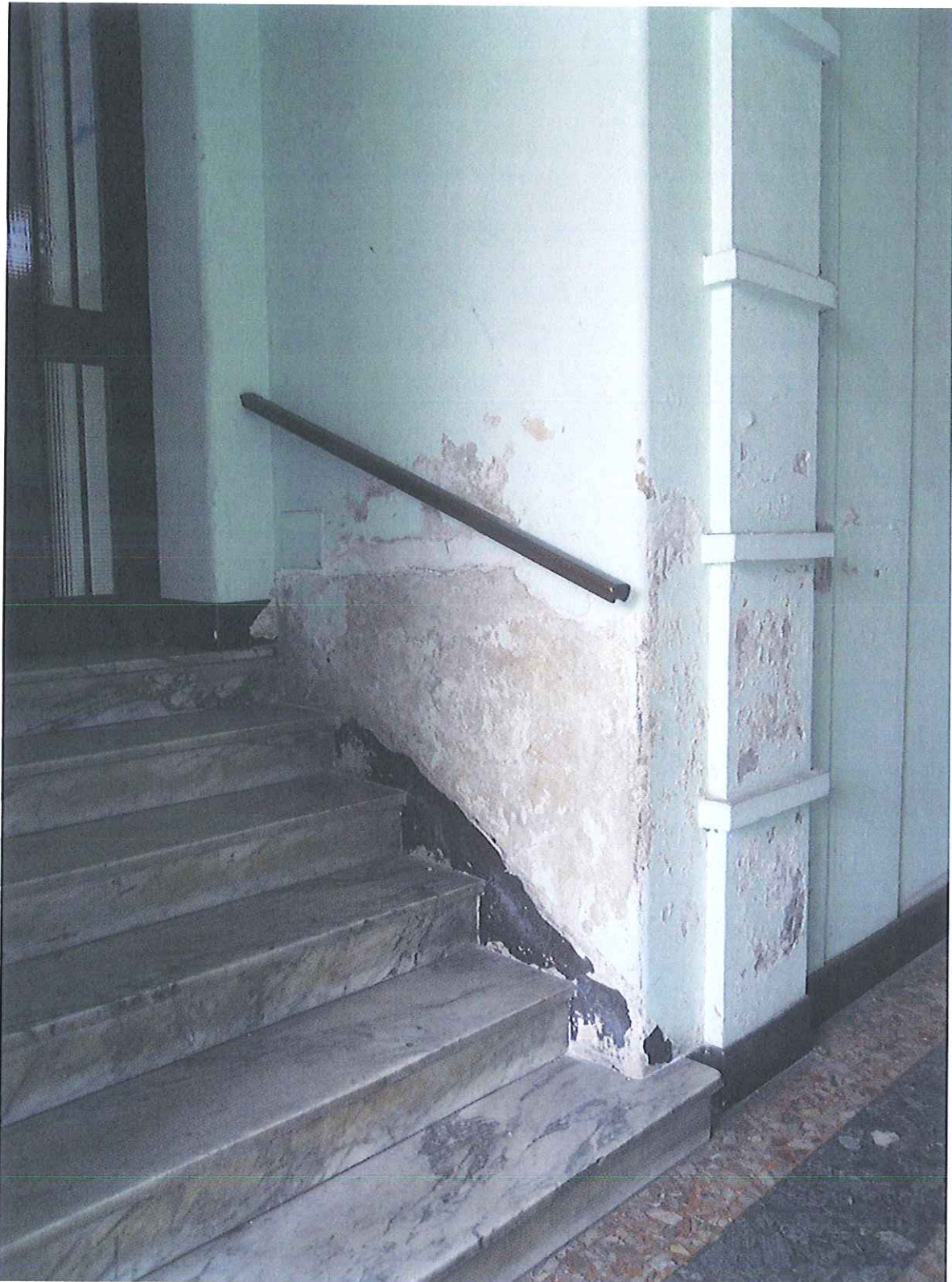
Androne carraio di Via N. Fabrizi