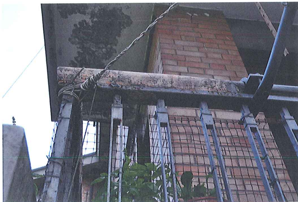
Particolare delle ringhiere