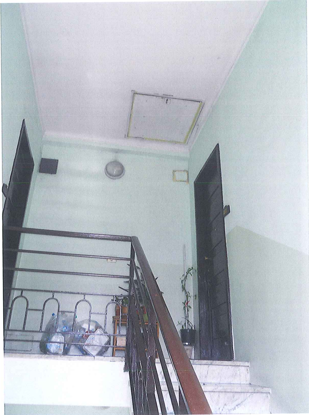
Vano scala Corso Lecce – Ringhiera di protezione