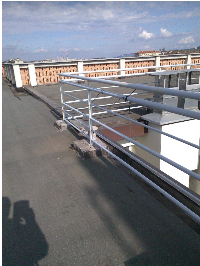
P.ZA S. GIOVANNI 5