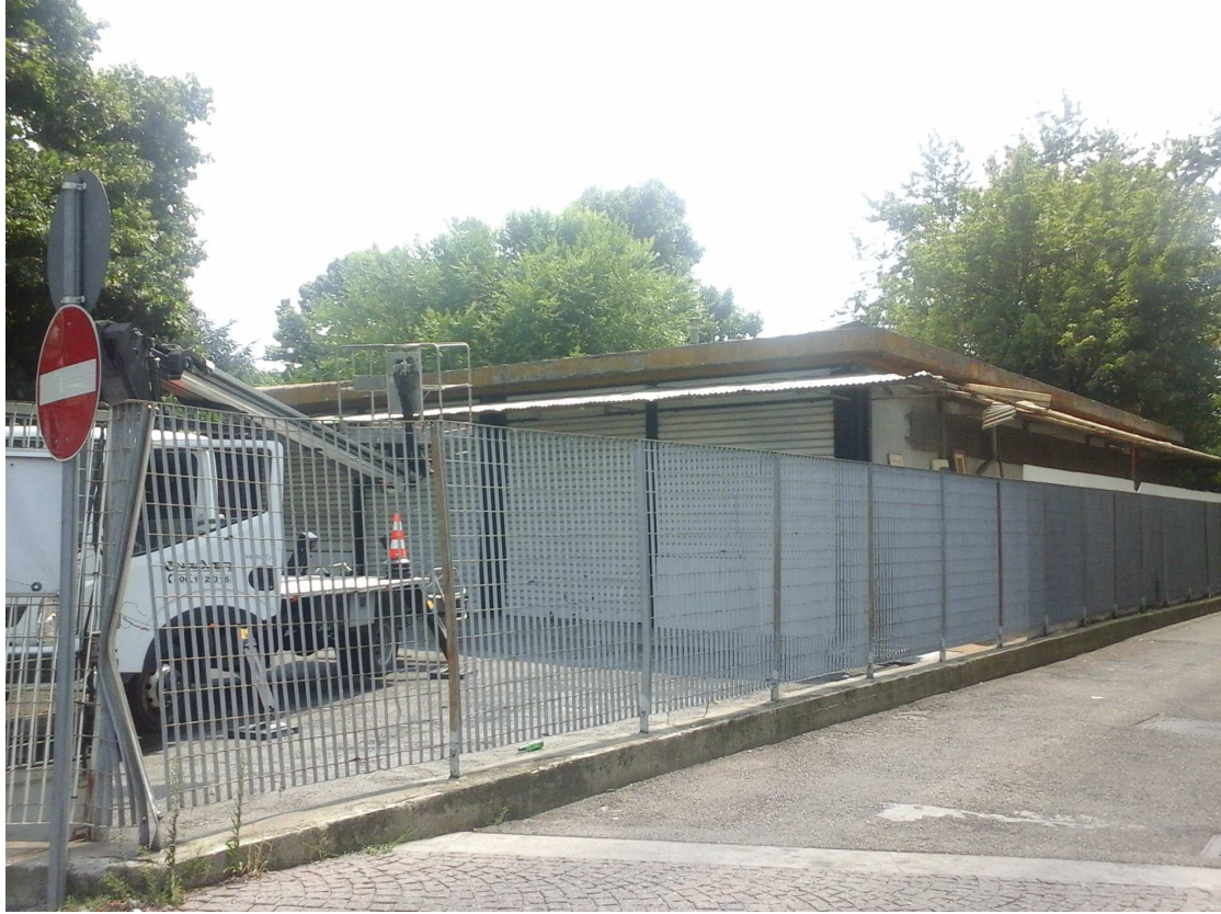
VIA FR. GARRONE 61