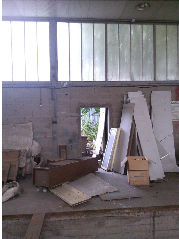
C.SO U. SOVIETICA 612