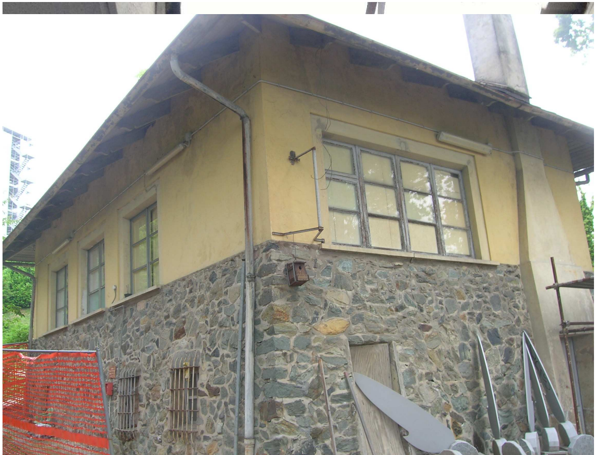
STR. S. VITO REVIGLIASCO 174