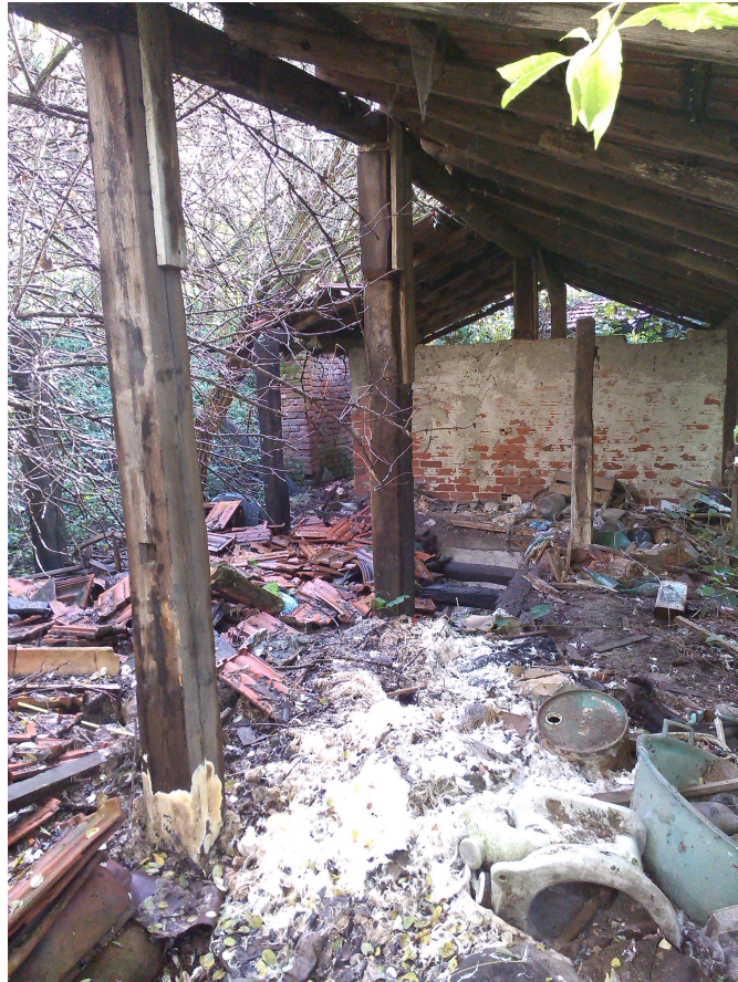
VIA GERMAGNANO INTERNO ENPA