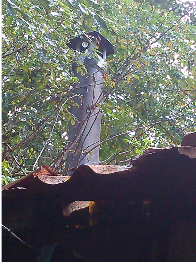
Canna fumaria in amianto