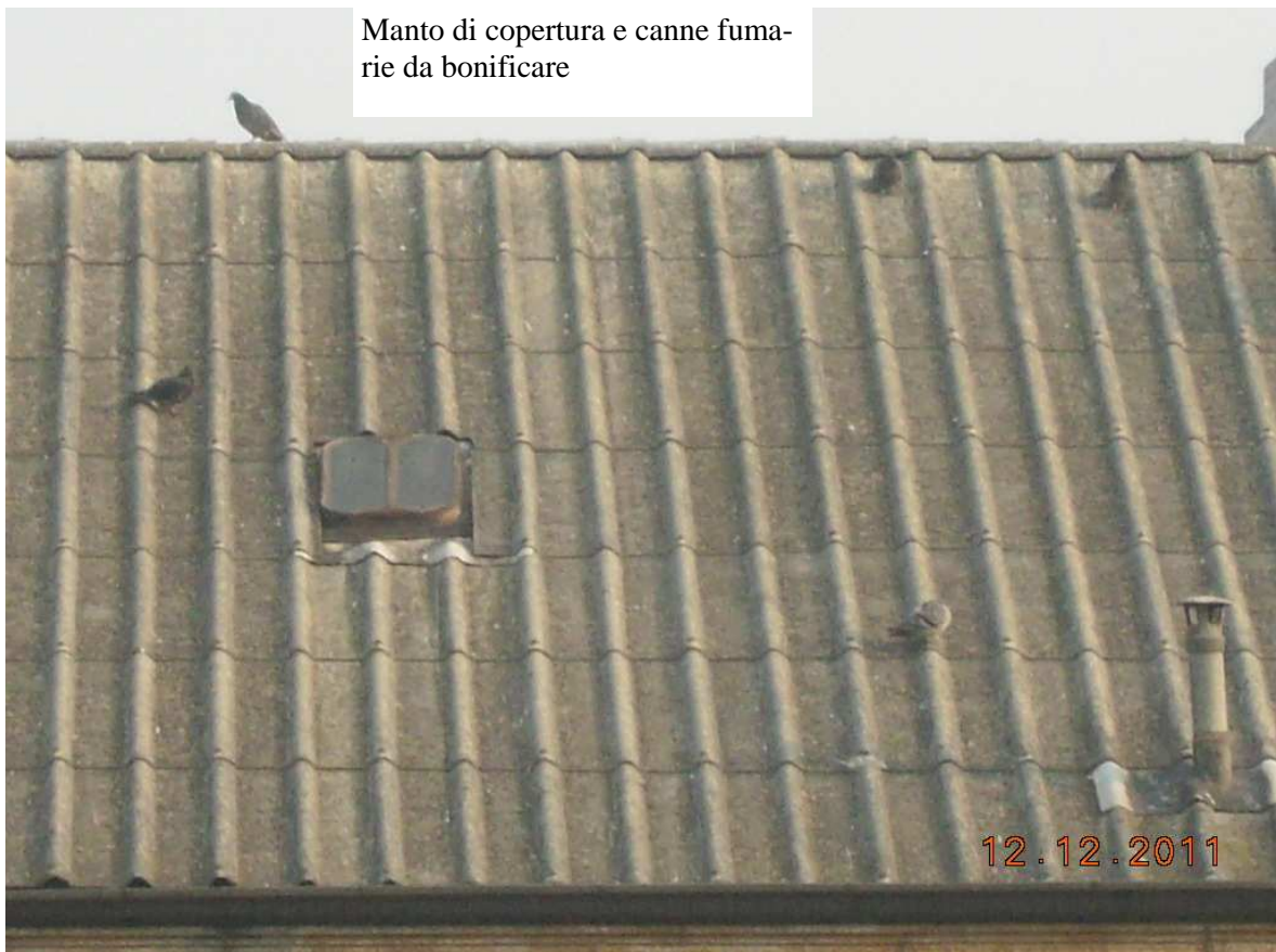
VIA NIZZA 410