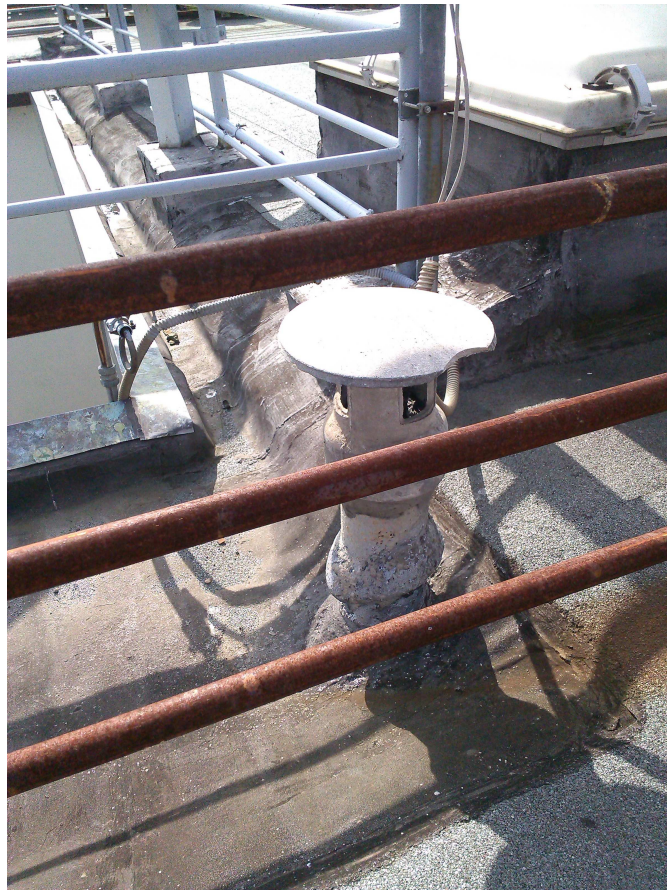
P.ZA S. GIOVANNI 5