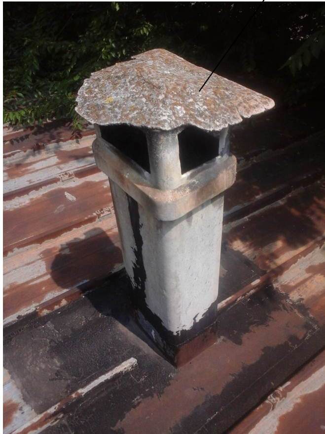
VIA FR. GARRONE 61