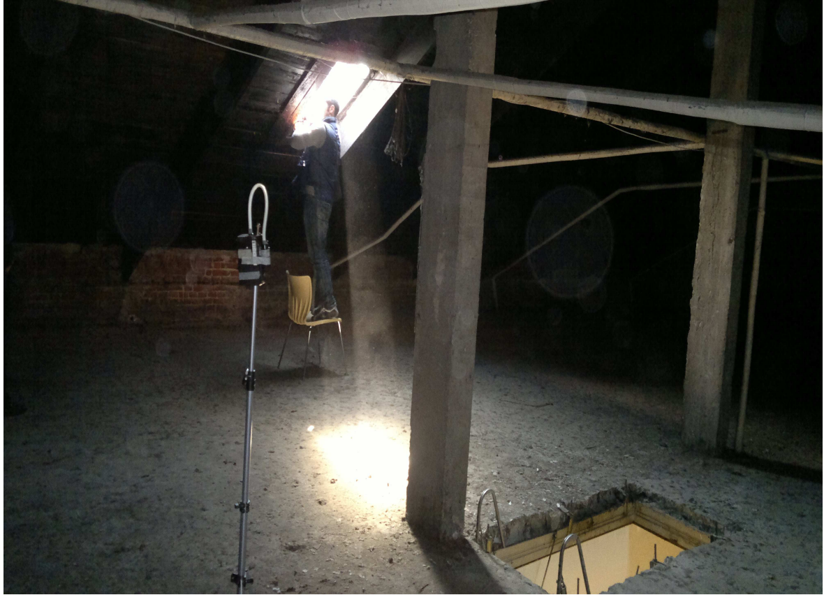
VIA NIZZA 410