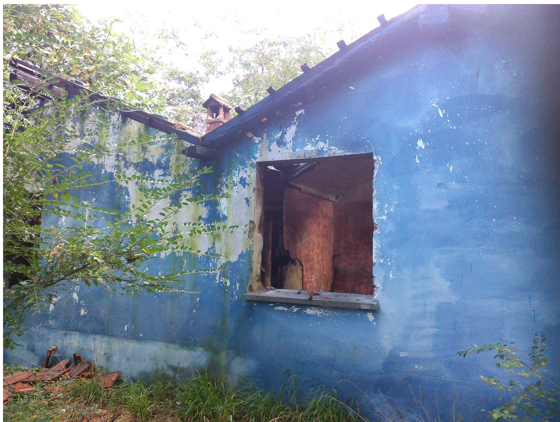
VIA GERMAGNANO INTERNO ENPA