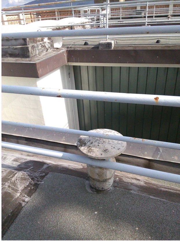
P.ZA S. GIOVANNI 5