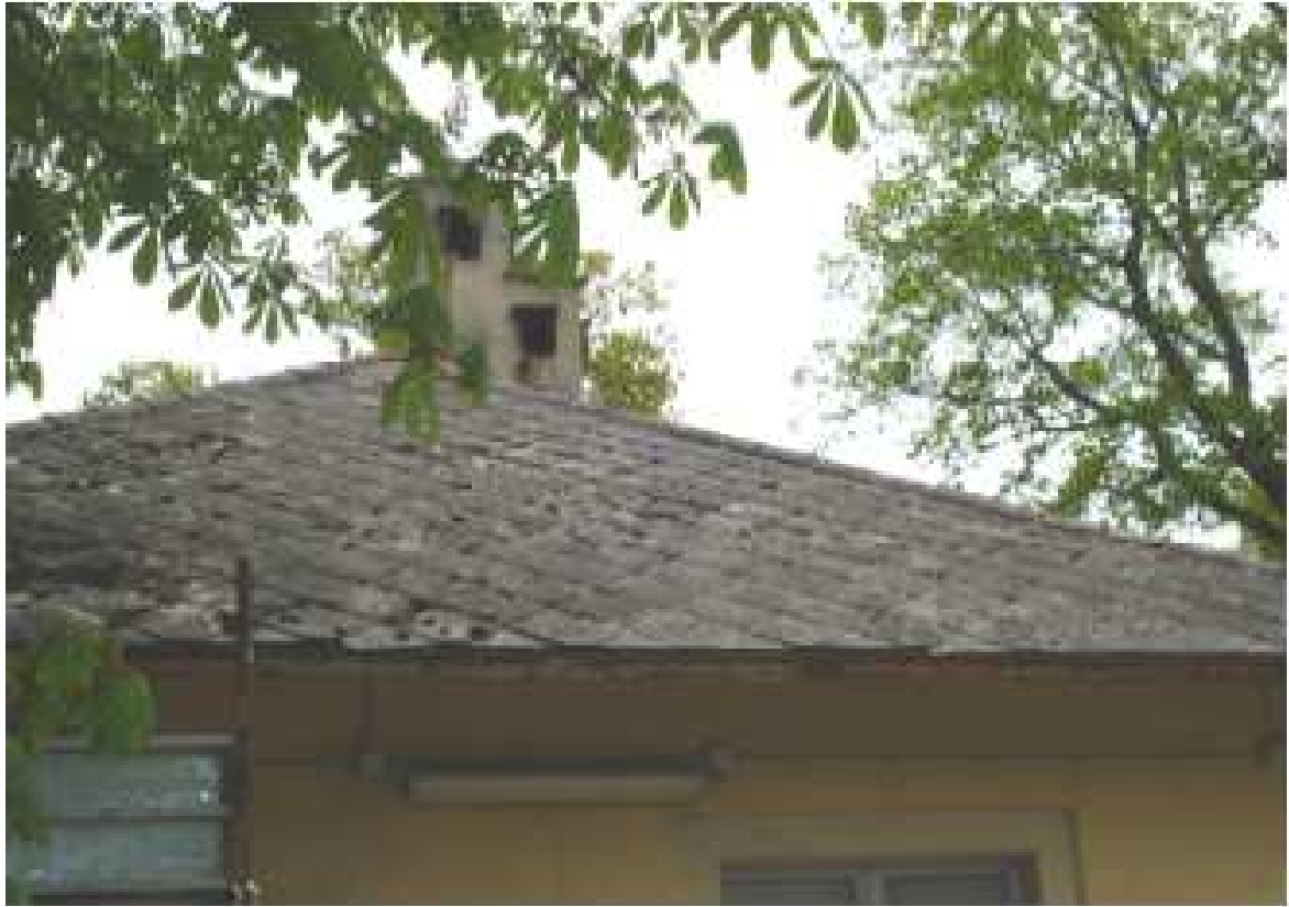
STR. S. VITO REVIGLIASCO 174