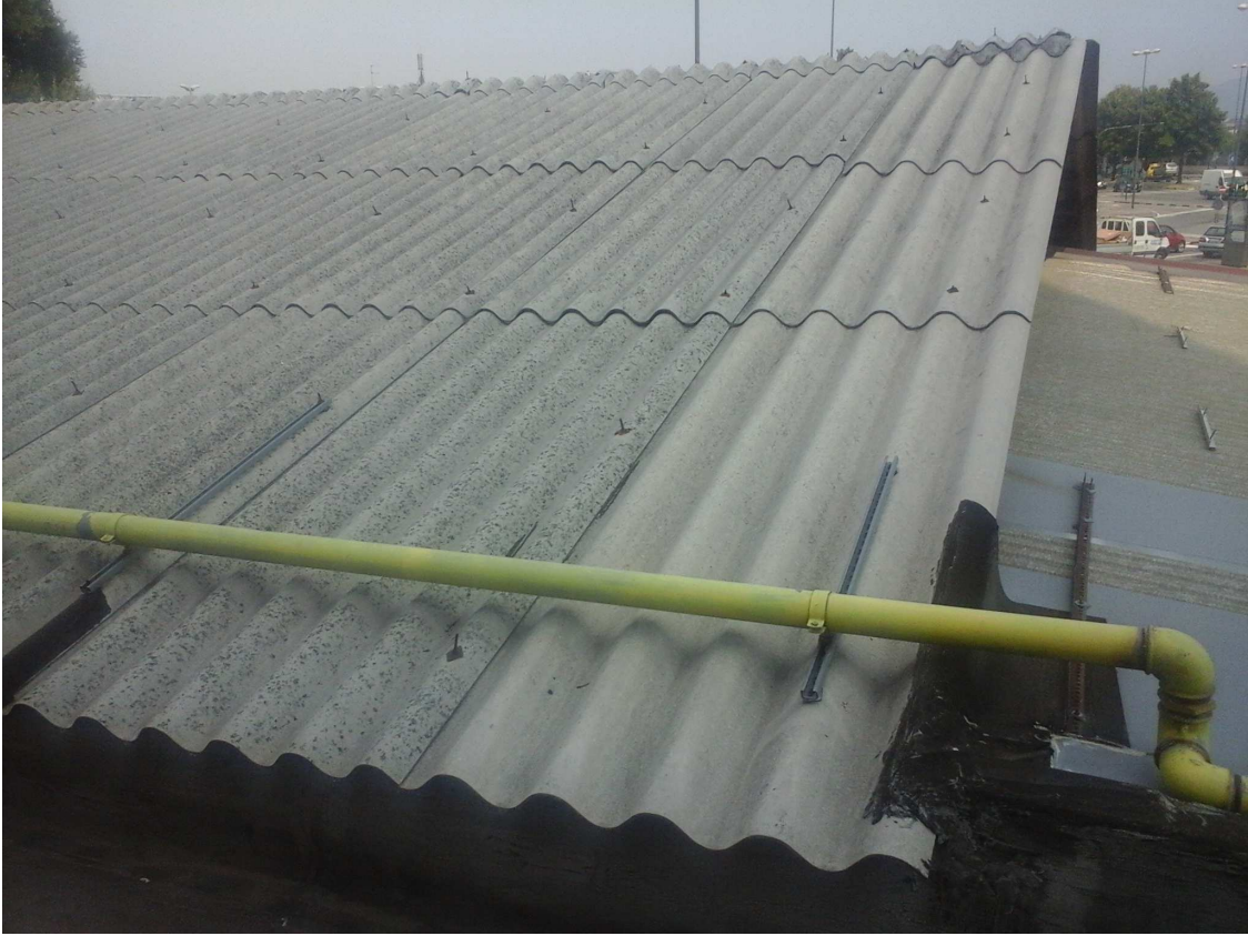
C.SO ORBASSANO 444