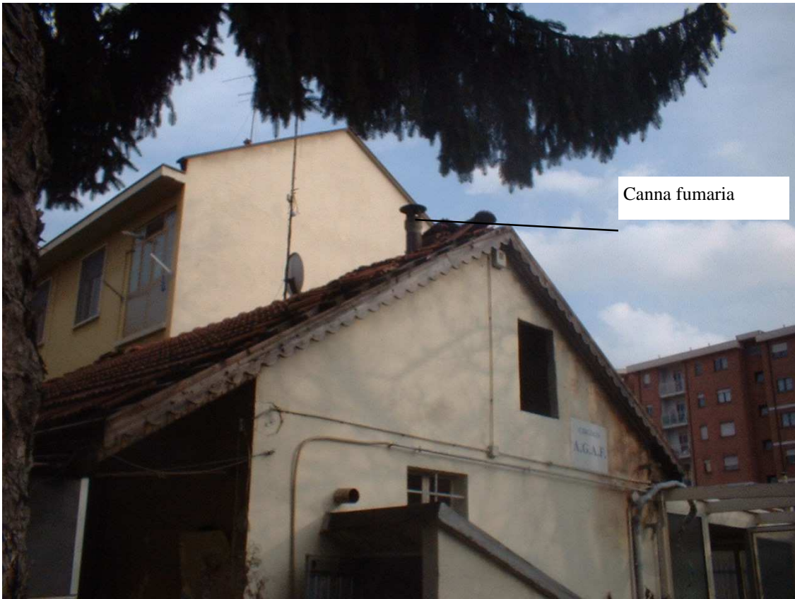
VIA CAVAGNOLO 9