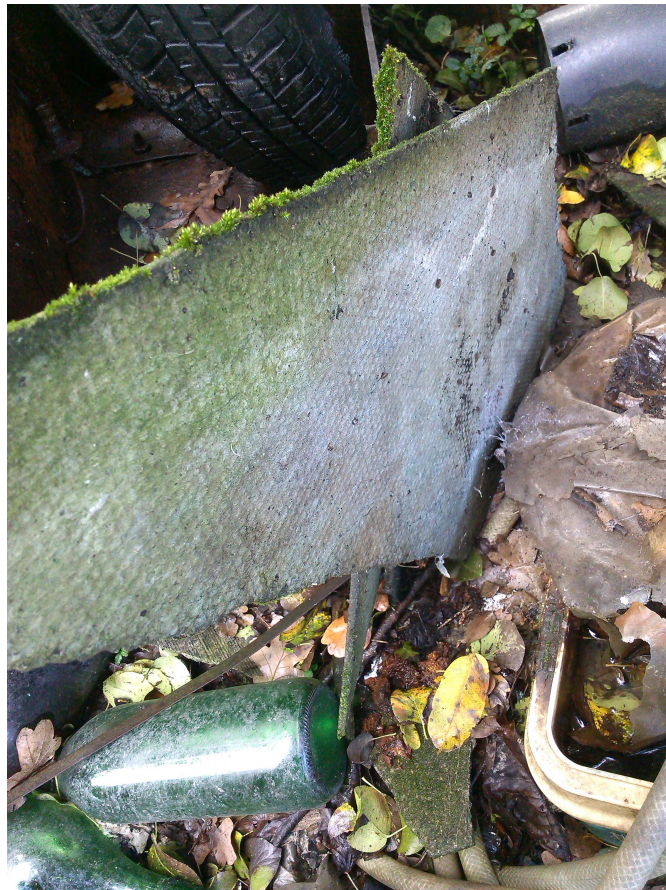
Amianto frazio- nato a terra