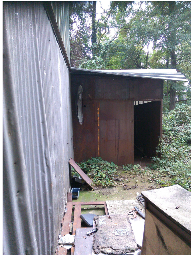
C.SO U. SOVIETICA 612