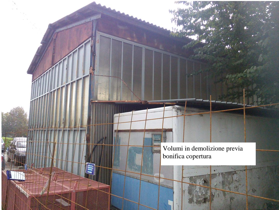
C.SO U. SOVIETICA 612