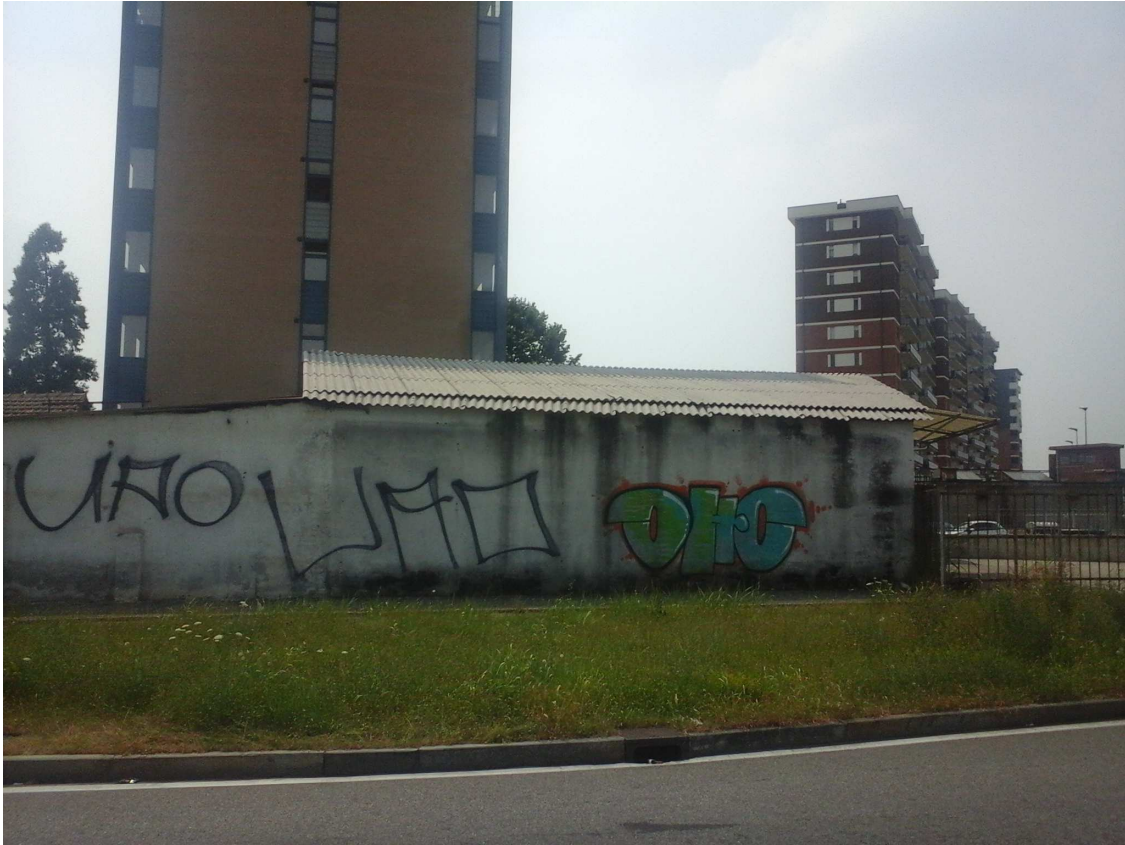
C.SO ORBASSANO 444