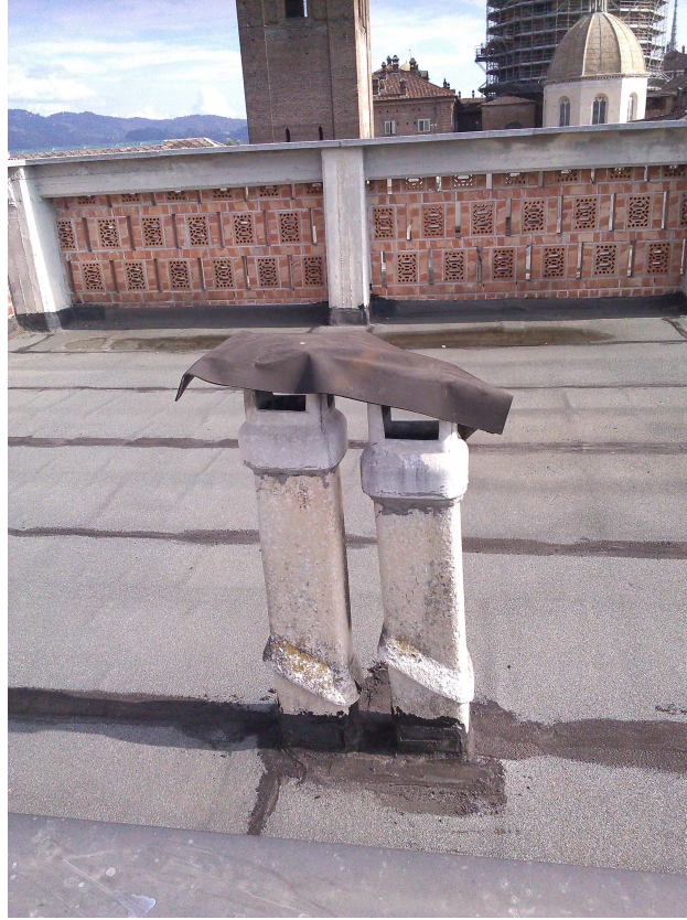
P.ZA S. GIOVANNI 5