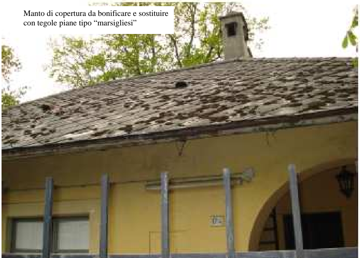
STR. S. VITO REVIGLIASCO 174