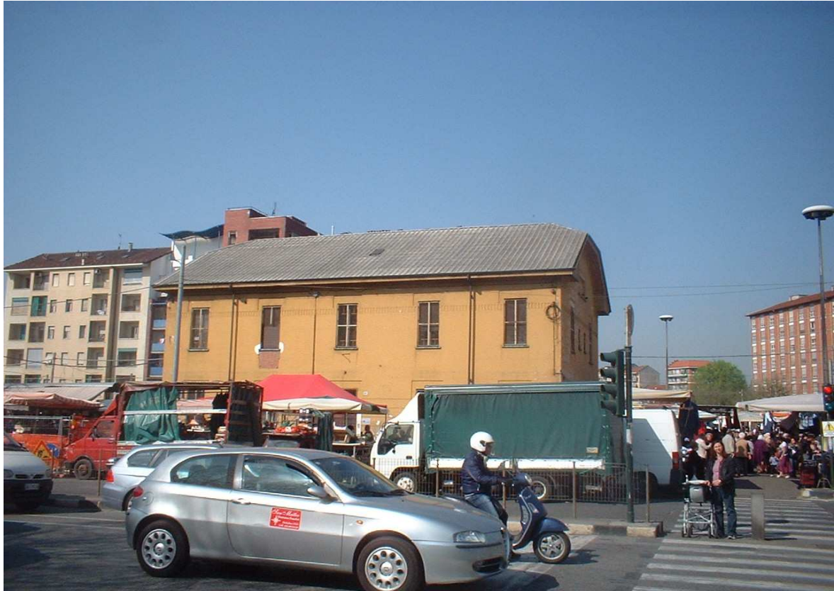
VIA NIZZA 410