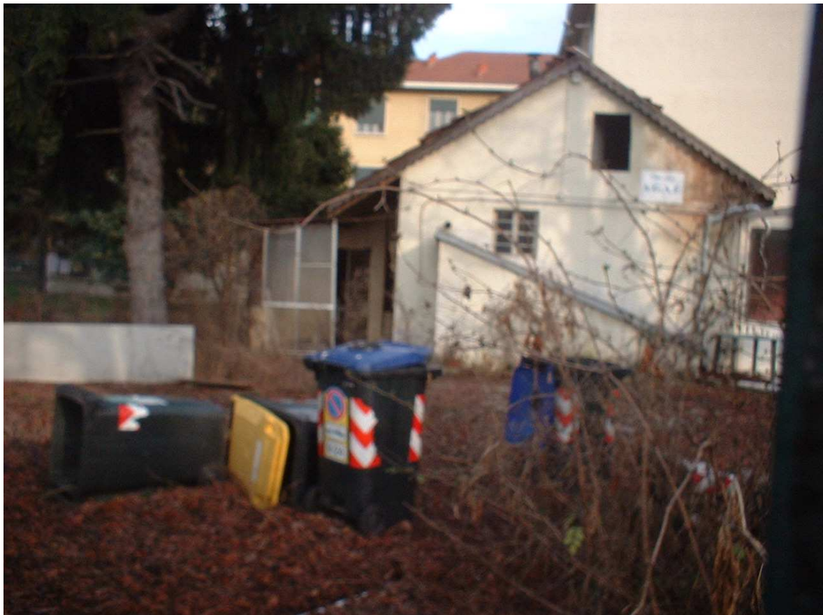
VIA CAVAGNOLO 9