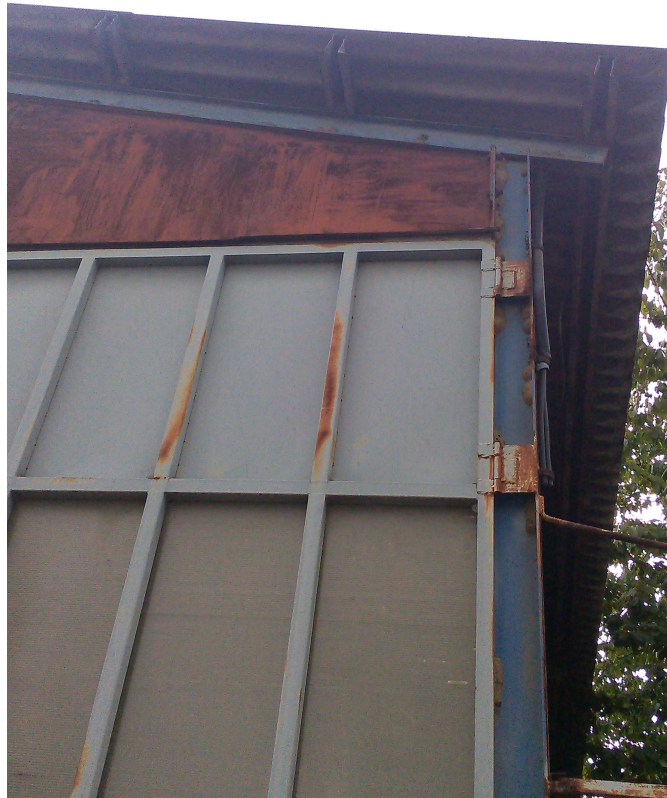
C.SO U. SOVIETICA 612