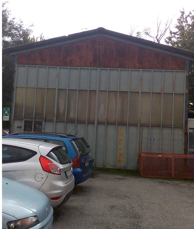
C.SO U. SOVIETICA 612