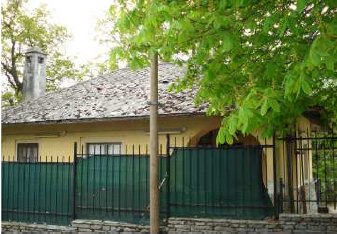
STR. S. VITO REVIGLIASCO 174