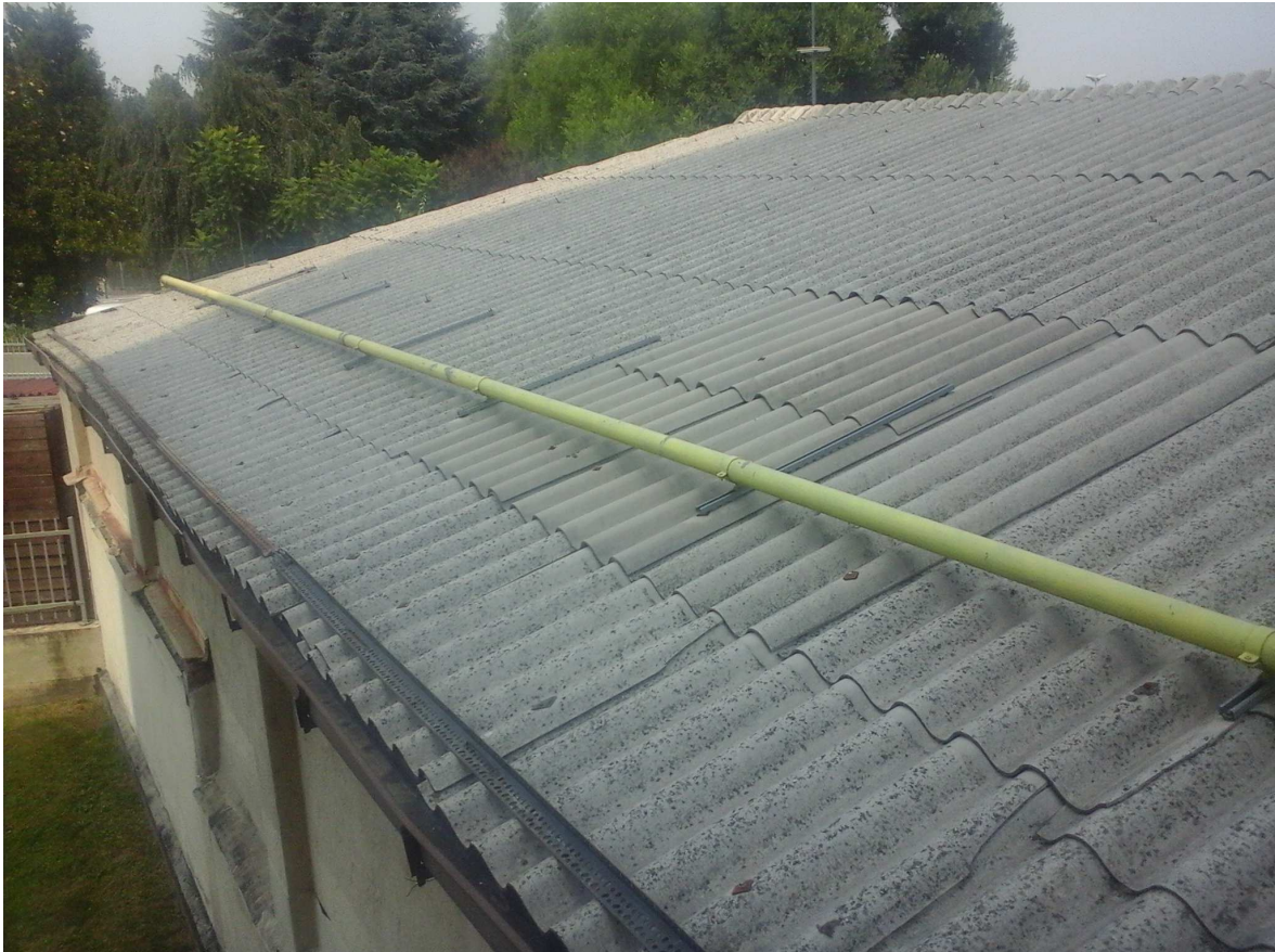
C.SO ORBASSANO 444