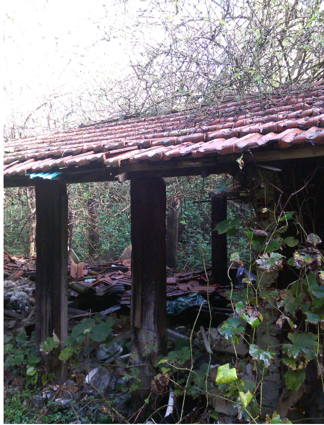
VIA GERMAGNANO INTERNO ENPA