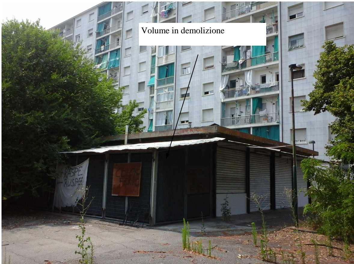
VIA FR. GARRONE 61