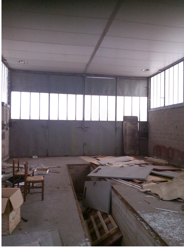
C.SO U. SOVIETICA 612