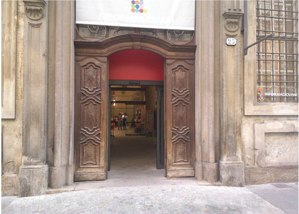
FOTO 5 V. Garibaldi 25