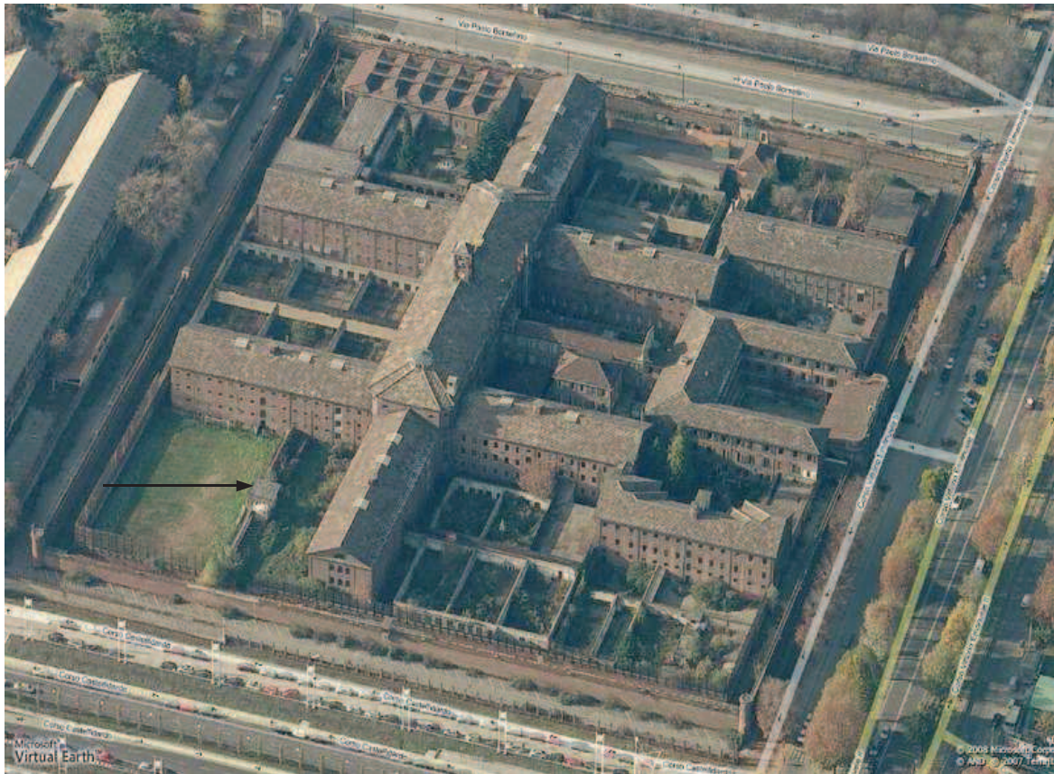
FOTO 43 V. Borsellino 3 Ex Carceri Le Nuove