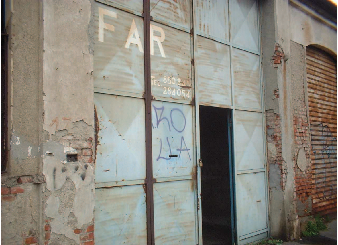
FOTO 21 V. Bologna 175 Ex Far