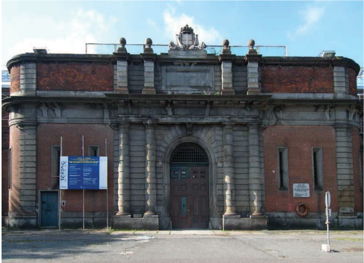
FOTO 41 V. Borsellino 3 Ex Carceri Le Nuove