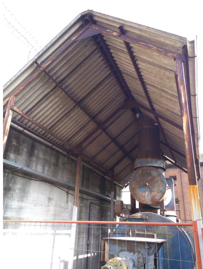
3 Ex Carceri Le Nuove