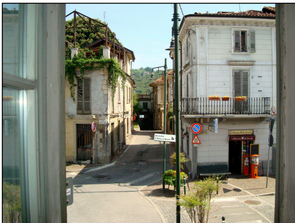
Vista verso la piazza Freguglia