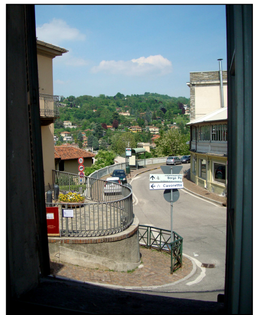
Vista verso la str. comunale di Cavoretto