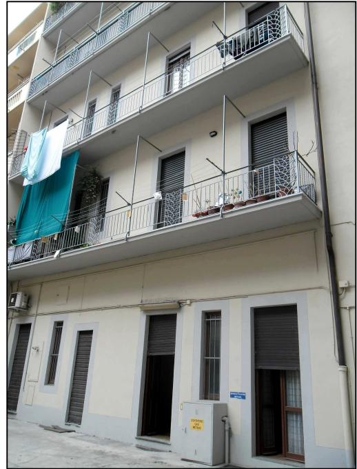
Prospetto facciata interno cortile