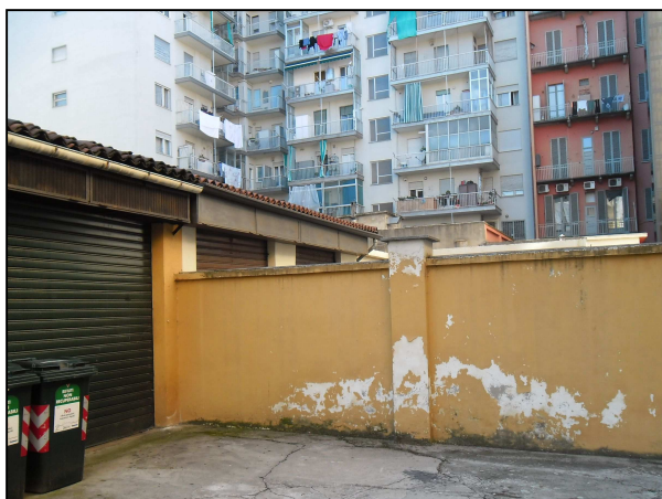
Vista serranda box