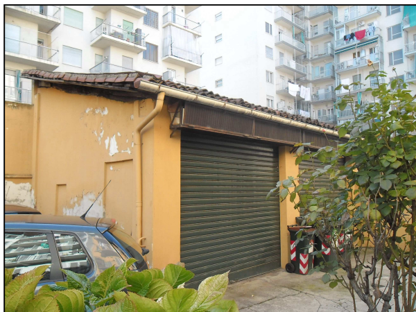
Vista serranda box