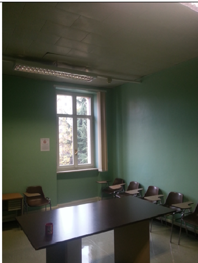
foto: vista di serramento esterno

A corredo delle opere specifiche, ai fini del raggiungimento della sicurezza generale degli ambienti anche per il rispetto del D.Lgs 81/2008, è prevista la revisione dei serramenti esterni in legno e la decorazione di alcuni ambienti di lavori e di porzioni di facciate esterne.