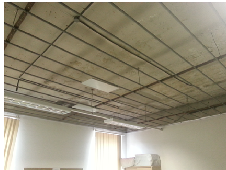
foto: particolare di un soffitto nel quale è stata portata a visto la rete di riscaldamento che deve essere sostituita

Per tutti solai che verranno lasciati liberi dopo la rimozione delle apparecchiature del riscaldamento a soffitto, per la messa in sicurezza dal rischio di sfondellamento e, ove necessario, per l'ottenimento della resistenza necessaria ai fini antincendio, è prevista la posa di una controsoffittatura certificata in aderenza o staccata.