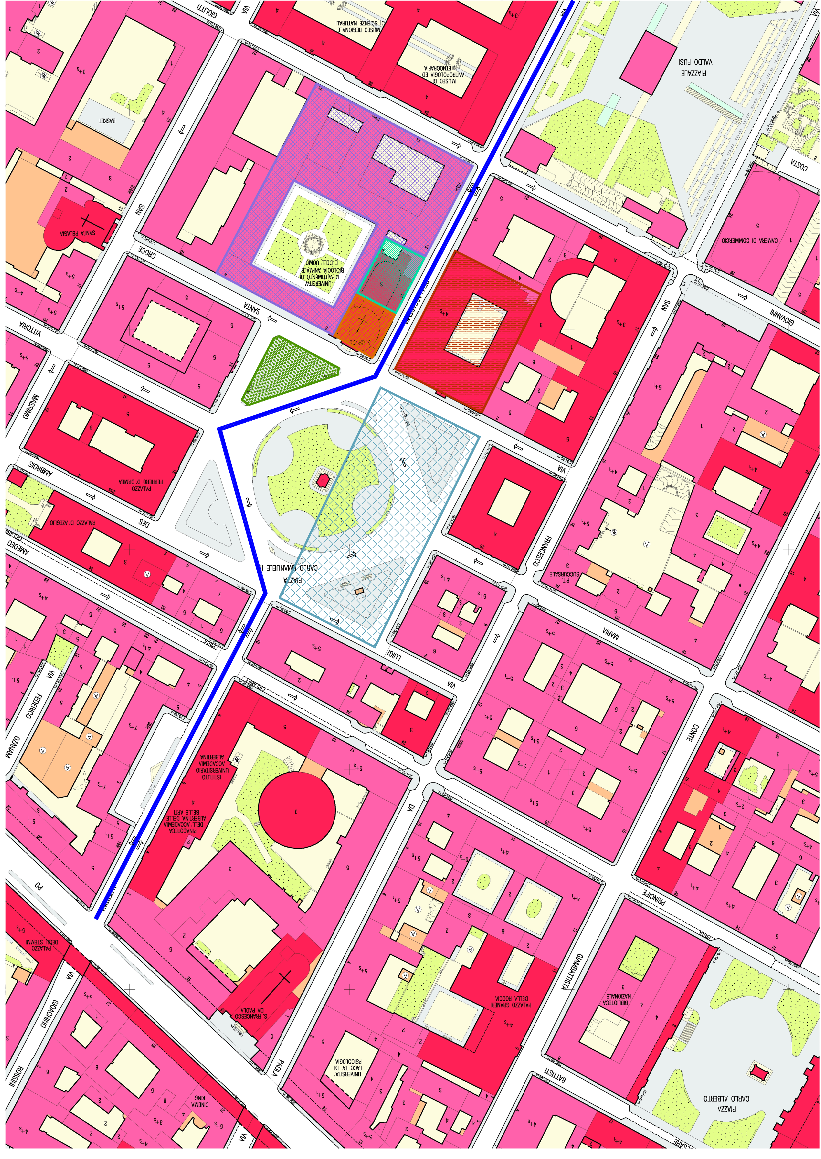
ESTRATTO CARTA TECNICA CITTA' DI TORINO