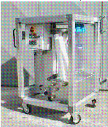
Gruppo filtrazione acque reflue

Al termine di ogni giornata lavorativa dovrà essere effettuata una scrupolosa pulizia delle strumentazioni utilizzate (U.D.D. escavatore, autocarro etc..) e delle aree che abbiano avuto significativo deposito di polvere, terreno o fango; tutti i materiali raccolti, e smaltiti come rifiuti contenenti amianto.