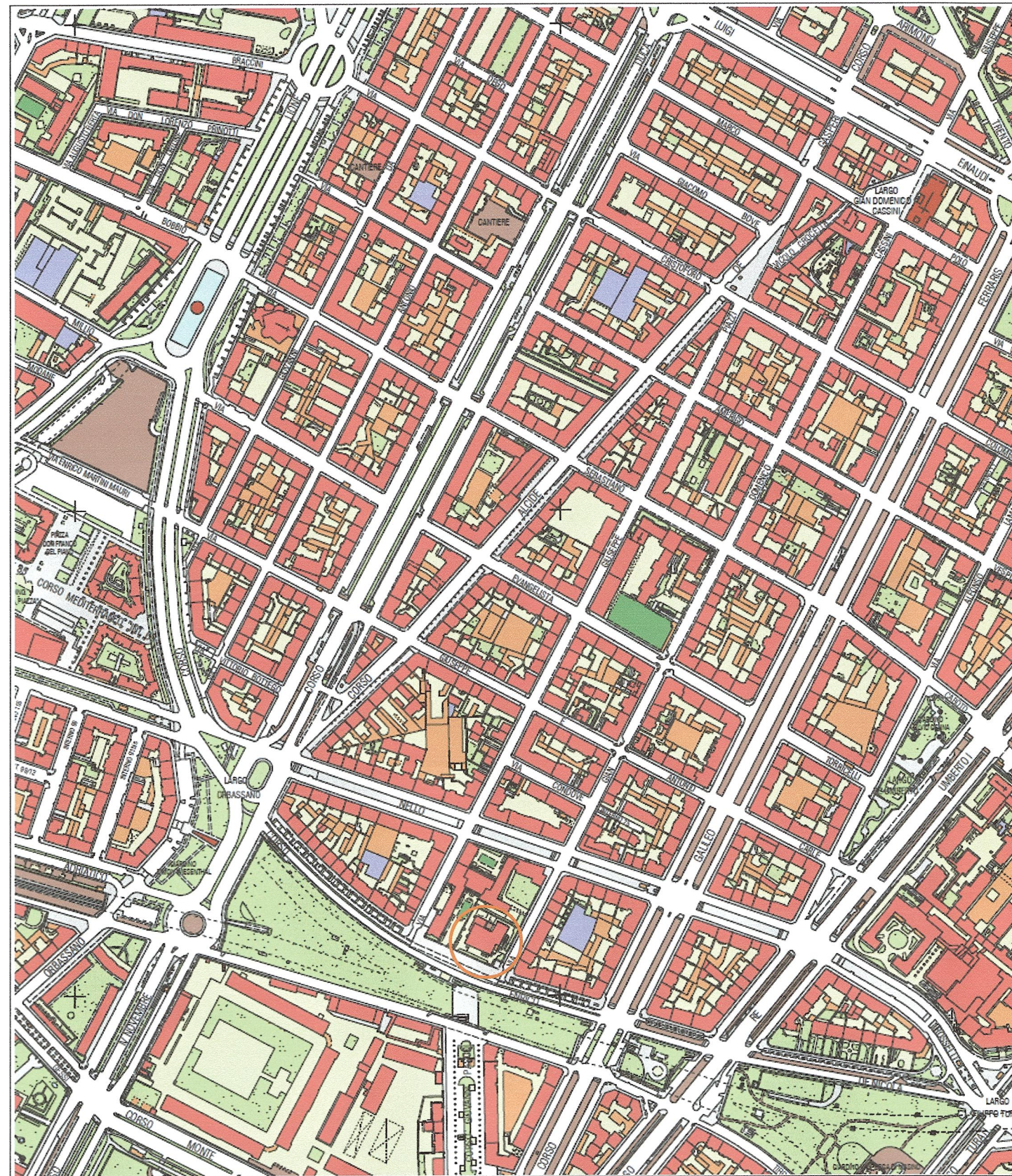
ESTRATTO DA P.R.G. Scala 1: 5000